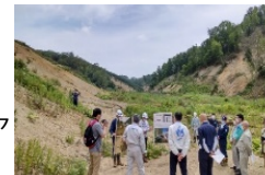
北海道厚真町の被災森林

・各地の被害森林の再生を推進 ・北海道胆振東部地震の被災森林について奥側に広がるエリアの再生を本格的に推進