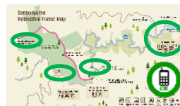
通話可能エリアマップの整備