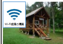
ワーケーション環境の整備（Wi-Fi整備）