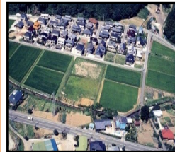
ほ場整備による農業生産性の向上と秩序ある土地利用の推進