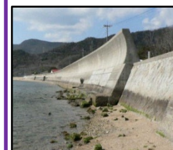
津波、高潮による被害を未然に防ぐため海岸堤防の整備を推進