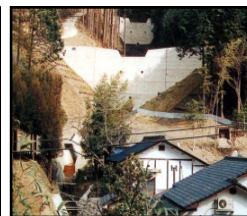
治山施設による山地災害の未然防止