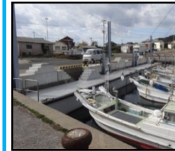
漁業作業の効率化と安全対策のための漁港整備（岸壁改良）