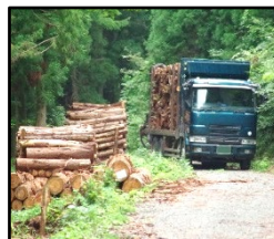
林道等の整備により効率的な間伐材等の搬出を実現