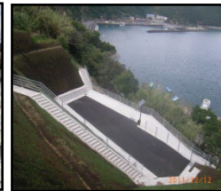
漁村における津波避難対策（避難地、避難路の整備）