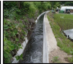
老朽化した用水路の整備・更新