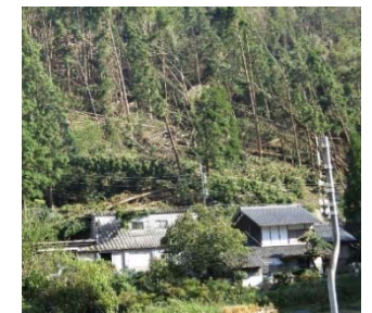
台風による民家裏の倒木被害（京都府）

台風等によって発生した被害木に起因した民家等への二次被害を防止するため、被害森林の間伐等と一体的に行う被害木の搬出を支援