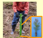
コンテナ苗による再造林