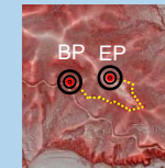
航空レーザ計測の実施

路網ネットワークを形成するため森林作業道、林業専用道、林業生産基盤整備道をバランスよく整備