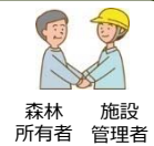
森林所有者 施設管理者