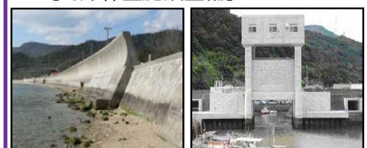
津波、高潮による被害を未然に防ぐため海岸堤防の整備を推進 津波・高潮対策としての水門整備