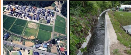
ほ場整備による農業生産性の向上と秩序ある土地利用の推進 老朽化した用水路の整備・更新