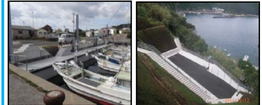
漁業作業の効率化と安全対策のための漁港整備（岸壁改良） 漁村における津波避難対策のための漁港整備（避難地、避難路の整備）