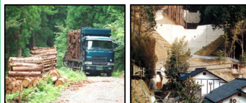
林道等の整備により効率的な間伐材等の搬出を実現 治山施設による山地災害の未然防止