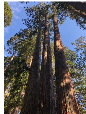
和歌山県の特別母樹（林）