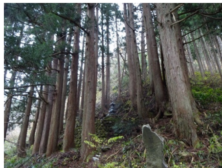
石川県の特別母樹（林）