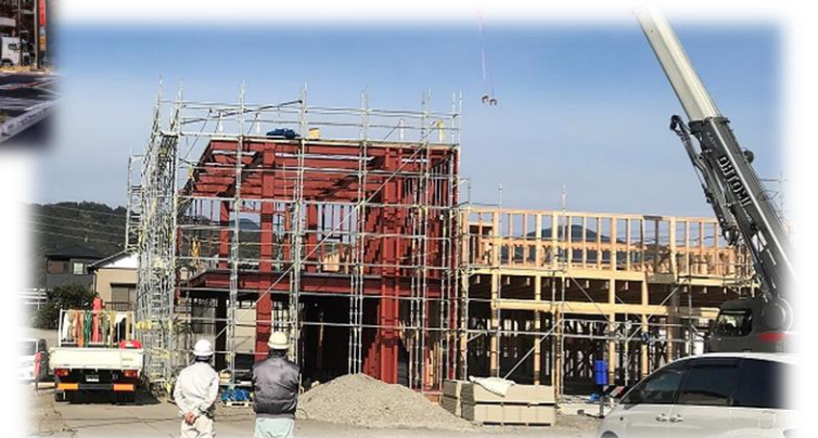
木造&鉄骨のハイブリット