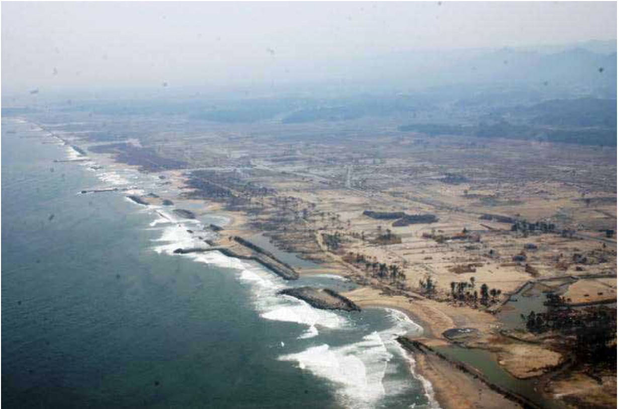
平成23年(2011年) 東北地方太平洋沖地震により発生した 津波により被災した海岸防災林 (宮城県山元町、東北森林管理局管内)