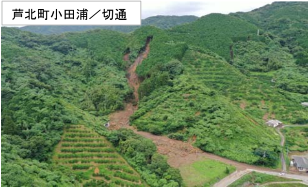
芦北町小田浦／切通