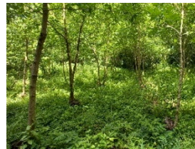
利活用等により機能の維持増進を図る天然林