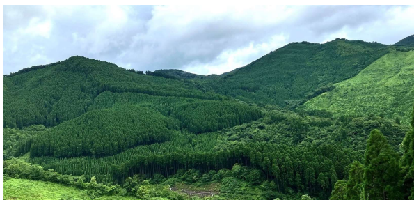
生育段階の異なる林分が連なる人工林の風景