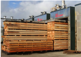
木材乾燥機(イメージ)

上記の事例以外にも、全国的に各製材工場等が工場の稼働率を上げるなど、国産材の建築用部材の増産に尽力しているところ