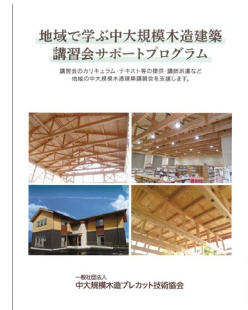
講習会パンフレット