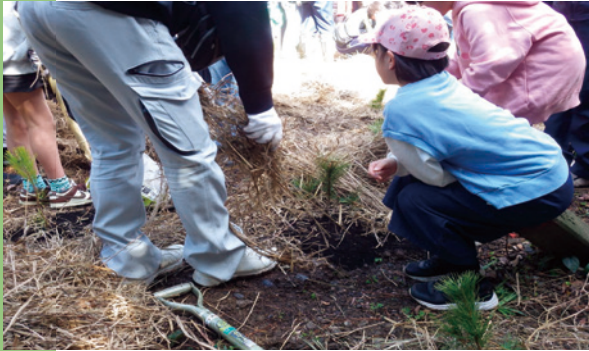
苗木の乾燥を防ぐための干し草を敷く作業