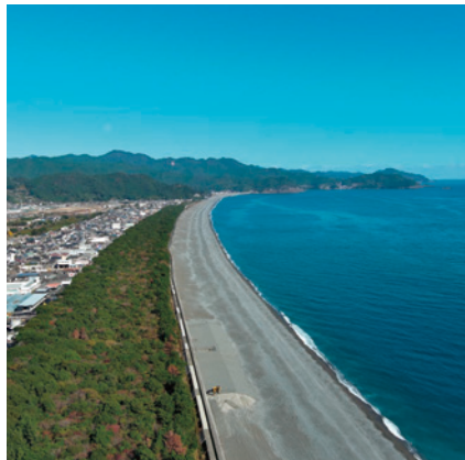
長さ25 kmにもおよぶ七里御浜の松林

七里御浜風致探勝林・林野庁 https://www.rinya.maff.go.jp/j/kokuyu_rinya/kokumin_mori/katuyo/reku/rekumori/shichiri.html