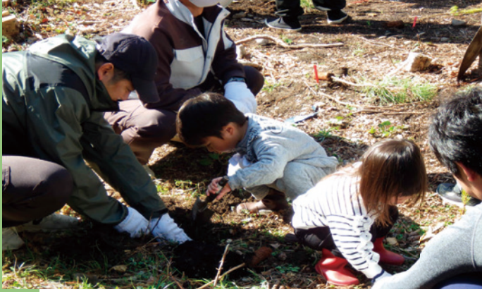
植林をしている様子

七里御浜国有林は、美しい景観と歴史をもちながら、地域の暮らしを守る防風林として重要な役割を果たしています。三重森林管理署では、この松林を未来へつなぐため、地域との連携を深めながらGG作戦などの取組を継続していきます。