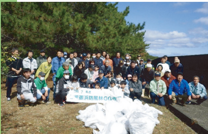
紀宝会場での集合写真