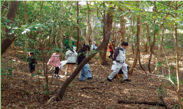
地元の子供たちとの清掃活動