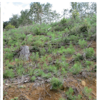
伐採跡地で自然発生している稚樹

さらに、ニホンジカの生息密度が一定以下の箇所(10-30頭/ha)では、防護柵を設置