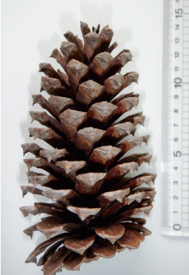
テーダマツ林と球果（松ぼっくり）

く、木材利用の面でも優れた特性を備えています。昭和30年代には、木材の増産を目的として全国で植栽が進められ、昭和40年代当分で全国に約1,500ha植栽されており、そのうち約1割を占める約160haの植栽が静岡県で行われていました。