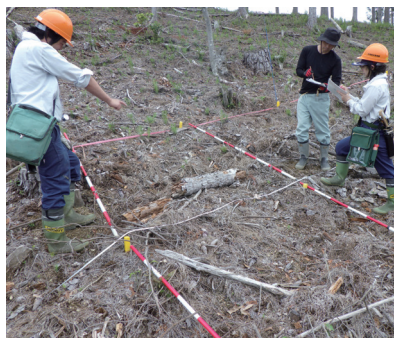
稚樹の発生・生育状況の調査