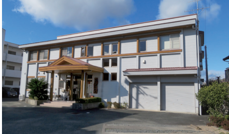
天竜森林管理署庁舎

天竜森林管理署では、適正な森林管理、木材の安定供給、大学や研究機関と連携した技術開発等の取組を進めてきたほか、天竜材販路拡大の取組として国、県、市、森林組合が連携したFSC森林認証取得を全国で初めて行いました。