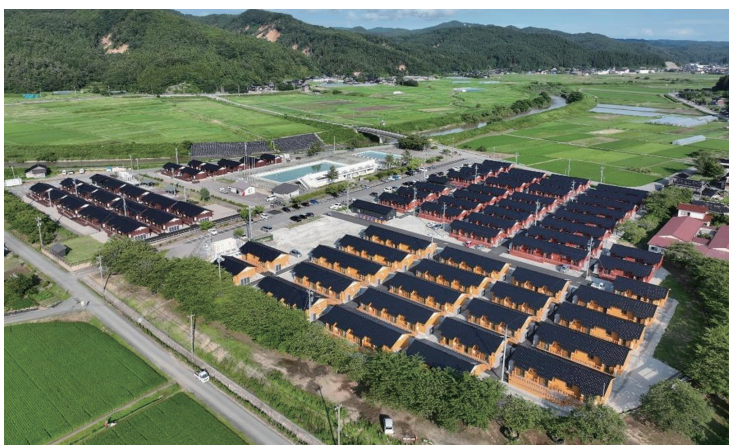
木造応急仮設住宅(令和6年能登半島地震、輪島市)