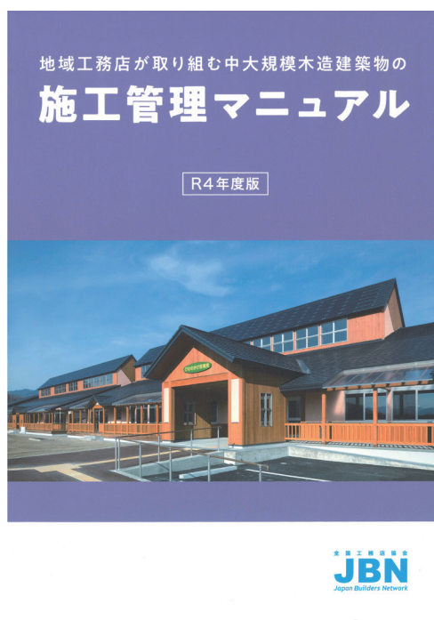
地域工務店が取り組む中大規模木造建築物の施工管理マニュアル

この他にもJBNでは協定に基づき様々な取組を実施しています。詳細はウェブサイトをご覧ください。 https://www.jbn-support.jp/