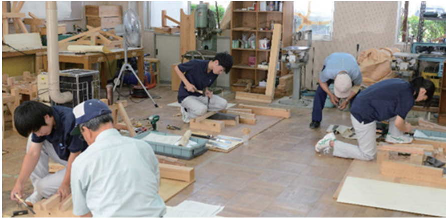
高校生向けの規矩術研修会