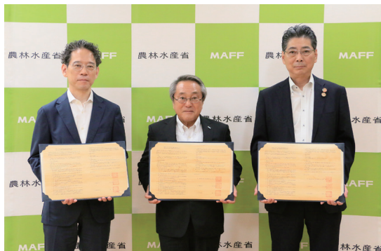
令和7年6月の協定締結 (左から宿本土交通省審議官(当時)、安成JBN・全国工務店協会会長、小坂林野庁次長(当時))

協定締結以降、特に力をいれているのは、建築大工の人材育成と災害における木造応急仮設住宅の建設です。