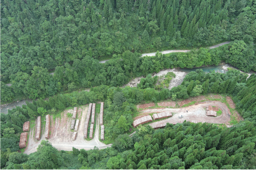
民有林と連携した土場の活用

この団地設定により、団地内の森林作業道や土場などを共用できるようになり、令和3年度には、当該団地で搬出間伐等と協出荷を行うとともに、隣接する私有林については経営管理実施配分計画が作成され、主伐・再造林が実施されました。