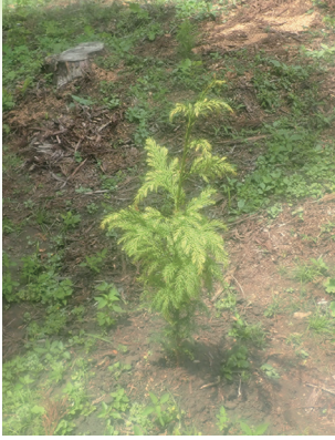
花粉の少ないスギ苗木の植栽

公益重視の管理経営の一層の推進を図るため、「水源涵養タイプ」、「山地災害防止タイプ」などの5つの機能類型区分ごとの管理経営の考え方に即し、花粉発生源対策を含め、適切かつ効率的な森林施業等を実施しました。