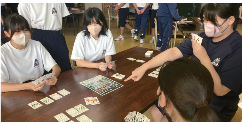
職員考案のカードゲーム「ZORING」を活用した森林環境教育