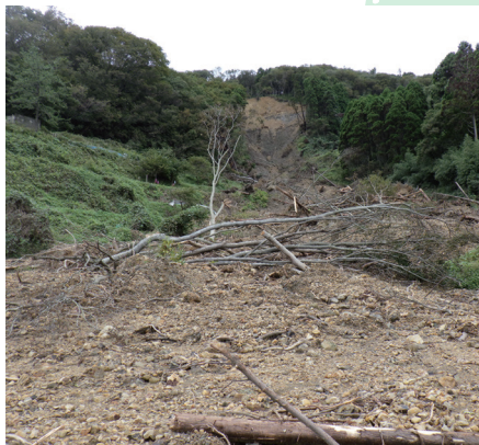
令和6年能登豪雨による被害と応急対策の実施

林直轄治山事業6区域内の10か所において、応急対策を実施しました。引き続き、早期復旧に全力で取り組んでいきます。