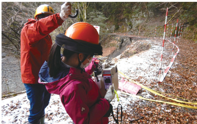
地上レーザ測量を用いた効率的な林道被害調査

東日本大震災からの復旧・復興に当たって、海岸防災林の復旧再生や福島県内の国有林野において森林整備等を推進しました。