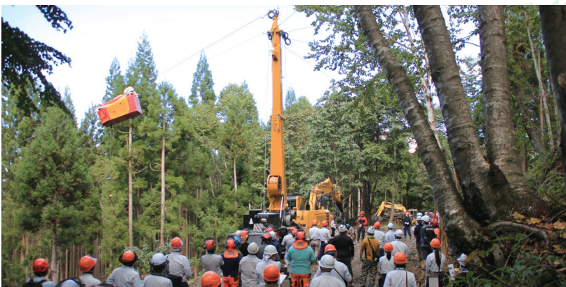
簡易架線作業システムの現地検討会