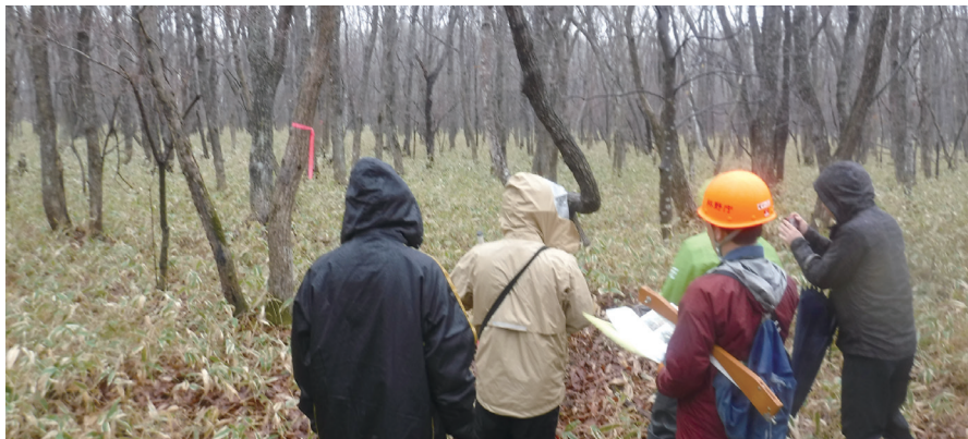
国庫帰属申請地の要件審査

また、適切な森林整備を通じた収獲量の確保やコスト縮減等による計画的かつ効率的な事業実行に努め、令和6年度は242億円の債務返済を行い、これまでの債務返済額は合計して2,155億円となっています。