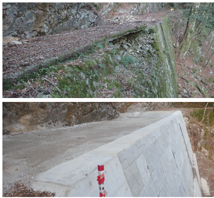
林道の改良工事(上:実施前 下:実施後)

併せて、生物多様性の保全に向けて、溪流周辺の森林の保全など、人工林も含めた森林の適切な保護・管理に取り組みました。また、「30 by 30目標」の達成に向けた保護林の新設・区域拡張や、企業による森林づくり活動へのフィールド提供等に取り組みました。