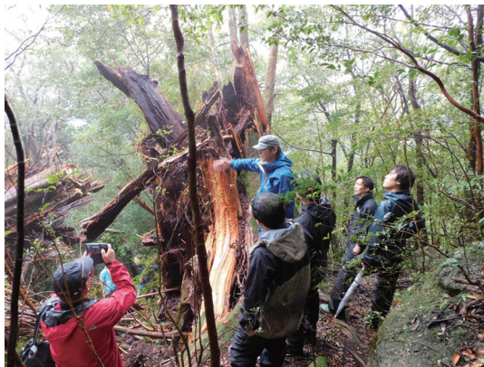
「レクリエーションの森」内で倒伏した巨木(弥生杉)の取扱いの検討

また、森林浴や自然観察等に適した森林を国民の皆さまに親しんでいただけるよう、「レクリエーションの森」として設定し、環境整備等に取り組みました。