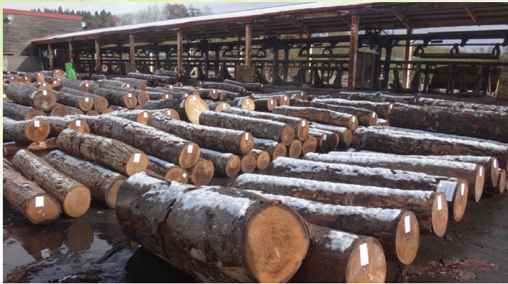
市場に供給された広葉樹