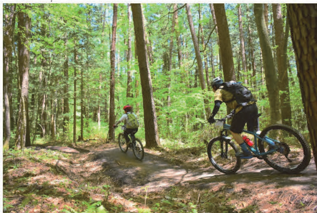
1撮影：山形県上山市地蔵（02020）。2撮影：長野県伊豆市地蔵。3撮影：群馬県高野町地蔵

林野庁では、森林と人、森林と企業がつながっていく、そんな「森業」の情報発信ポータル「森業portal」を開設。