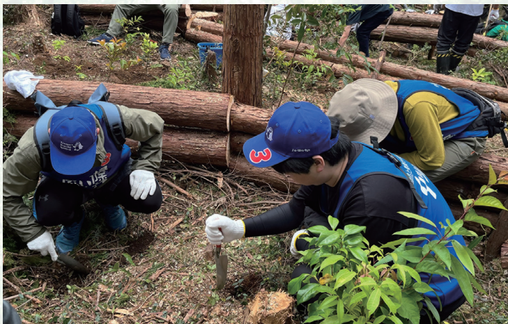
企業による森林づくり活動

地域貢献として森林づくり活動が進められているほか、企業研修のフィールドとしての森林利用や森林由来J-クレジットの取引を通じてつながりの生まれた地域と企業とが連携した森林づくり活動等も広がっています。