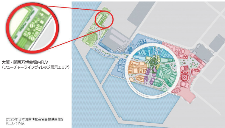
大阪・関西万博会場内FLV (フューチャーライフヴィレッジ展示エリア)

展示期間：2025年9月23日(火)～9月29日(月) 展示場所：大阪・関西万博会場内フューチャーライフヴィレッジ (FLV)