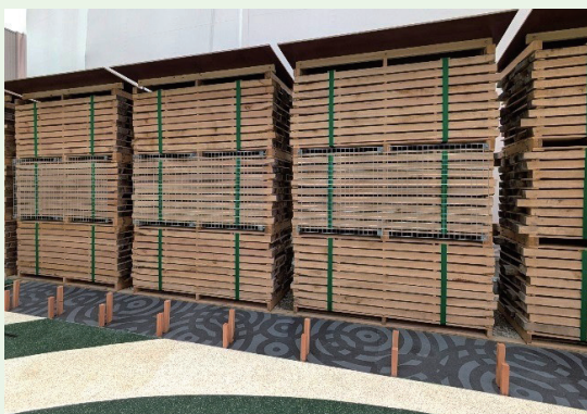
万博での福島県産コナラの展示

トラック床板の大手メーカーである越井木材工業株式会社のほか、北海道運輸株式会社及び日本フルハーフ株式会社のご協力を得て進めています。床板に使用するコナラは、床板に加工する前に放射線量を測定して問題ないレベルであることを確認しています。また、コナラはトラックの床板として十分な強度性能があり、今後の利用拡大が期待されています。現在、大阪・関西万博のよしもとパビリオンにおいて、福島復興支援の観点から床板に製品化する前のコナラ板をフェンスとして設置し、復興支援のPRを行っています。万博に行かれた際はぜひ立ち寄りください。