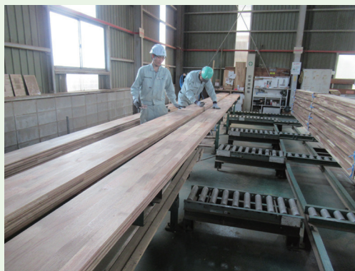
コナラ床板の製造

等を新たにトラック荷台の床板として活用する取組を進めています。トラック床板への活用は、大阪市に本社を置くト