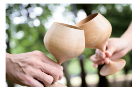
木製フイングラスIPPONGI