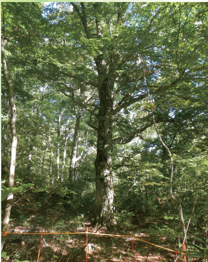
マザーツリー後継「白神いざないツリー」(英語表記: Shirakami Welcome Tree)