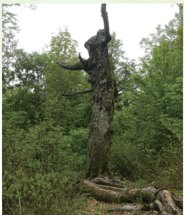
枯死発表時の「マザーツリー」 2024年撮影

による駐車場・トイレの整備を行ってきたところ、徐々に来訪者が増え、マザーツリーは人気の観光スポットになりました。白神山地の象徴的な存在として親しまれてきたマザーツリーでしたが、時の経過とともに樹勢の衰えがみられたため、民間ボランティアによる土壌改良などの策が講じられました。しかし、2018年9月の台風により幹が折損して以降、急激に樹勢が衰退し、2024年には春の芽吹きがなことから、樹木医により「枯死」と診断されました。この発表は多くのメディアに取り上げられ、「大変残念に思う」などの声が寄せられるなど、大きな反響がありました。