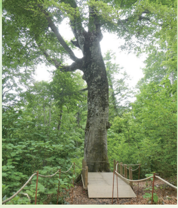
台風以前の「マザーツリー」 2018年撮影

白神山地は、青森県西部と秋田県北西部に広がる、約13万haに及ぶ広大な山地帯の総称であり、このうち東アジア最大の原生的なブナ林が広がる約1万7千haが、1993年（平成5年）に世界自然遺産に登録されました。登録地域の北東に位置する津軽峠付近には、推定樹齢400年以上とされるブナの巨木があり、津軽森林管理署は、2000年頃にこの巨木を「マザーツリー」と命名しました。その後、当署による遊歩道、案内標識等の整備や、青森県