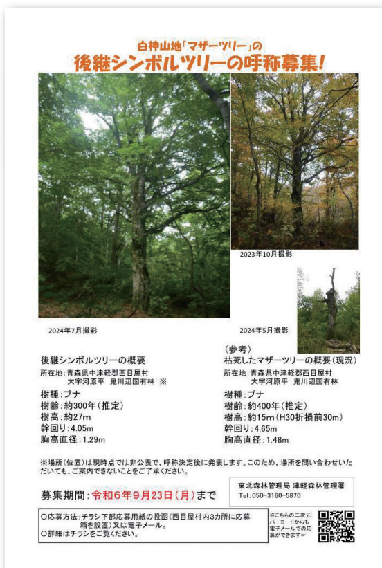
募集したポスター

白神山地を訪れる際は、ぜひ「白神いざないツリー」にお立ち寄りください。なお、アクセス道である青森県道28号岩崎西目屋弘前線は、例年11月中旬から5月下旬まで冬季閉鎖期間となるため、お越しの際は道路情報をご確認下さい。