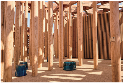
ウズベキスタン館