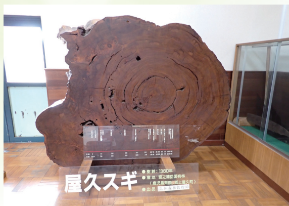
みどりの交流館屋久スギ