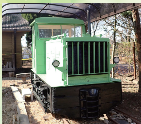
野村式ディーゼル機関車