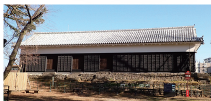
監物櫓(熊本市により管理)

重要文化財に指定されています。細川家の時代には「長岡図書預り櫓」と呼ばれていました。敵の襲来に備えた「石落こし」や鉄砲を撃つための窓「狭間」などを有し、砦の役割を果たしていました。