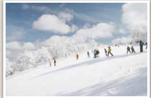
樹氷と大パノラマを満喫

グレンデは向坂山の北斜面に位置し、最大傾斜 30° のハードバーンが待つダイナミックコース (650m)、クルージングを楽しめるパラダイスコース (1,000m)、子供が雪遊びをできるファミリーグレンデがあり、スノーボードは全面滑走可能です。ハードなトレーニングからのんびりクルージング、家族での雪遊びまで、バラエティ豊かにお楽しみいただけるコースレイアウトとなっています。