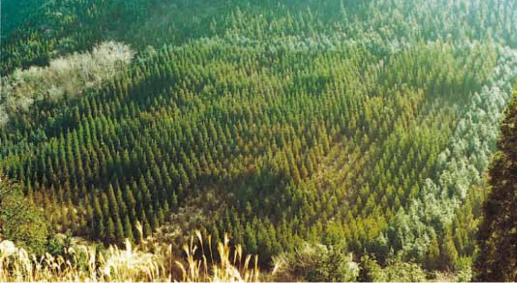
写真1 スギの次代検定林