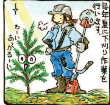
夏の林業作業 下刈りとつる切り、巻