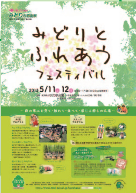
みどりの感謝祭ポスター