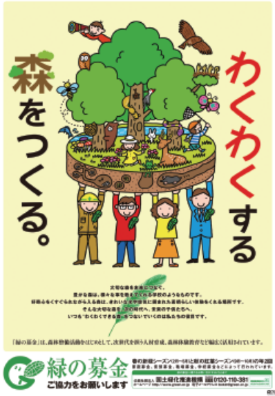
緑の募金ポスター