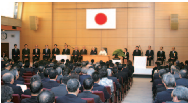
両陛下に御臨席を仰ぎ開催された第6回式典の様子

今年も「緑の募金」でふせごう地球温暖化」をスローガンとして、みどりの月間を全国一斉強調月間とし、全国各地で様々な行事が行われます。皆様のご理解とご協力をお願いいたします。