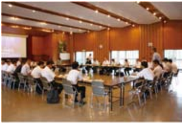
協議会総会の様子

昨年末の時点で六万箱を普及することができ、森林組合等を通じて約二〇〇万円の「還元金」が森林所有者に支払われました。 さらに、今年の一月と二月を「間伐紙普及促進重点月間（後期）」に設定し、コピー用紙の平成二二年度分の入札が目前に迫った県庁や町村等への普及を更に強化していきます。昨年一二月には、「木になる紙」コピー用紙に『カーボン・オフセット』が付与されることとなり、A4サイズ一箱（二五〇〇枚入）を購入すると自らの二酸化炭素排出量から1kgを削減できることとなりました。国際的にも二酸化炭素吸収量の売買が本格的に動き出そうとしており、削減に取り組む一般企業へ売込む際の強力な『付加価値』になると期待しています。