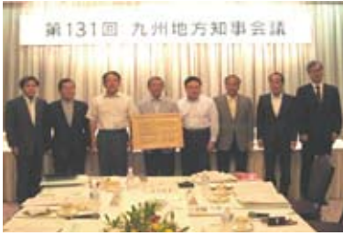
「国民が支える森林づくり運動」推進協議会会員