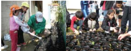
どんぐりの水やり