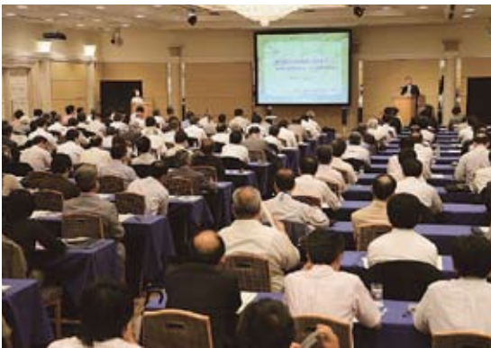
7月2日に開催された「山村きぎょうセミナー」

山村再生支援センターは、森林資源をはじめとした山村特有の豊富な資源を活用したい皆さまに開かれています。山村と企業等との仲人役を務めてまいりますので、ぜひご活用下さい。