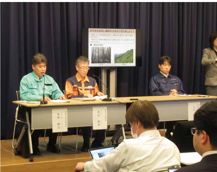
気象庁・消防庁・林野庁合同での記者会見

討会報告書」を受け、林野火災注意報の創設、林野火災警報の的確な発令(注)のほか、林野火災に係る広報・啓発の強化の取組が進んでいます。そのひとつとして、今年から、気象庁、消防庁、林野庁が顕著な少雨時に火の取扱いへの注意喚起を行うこととし、令和8年1月22日に初めて3庁合同での記者会見を実施しました。