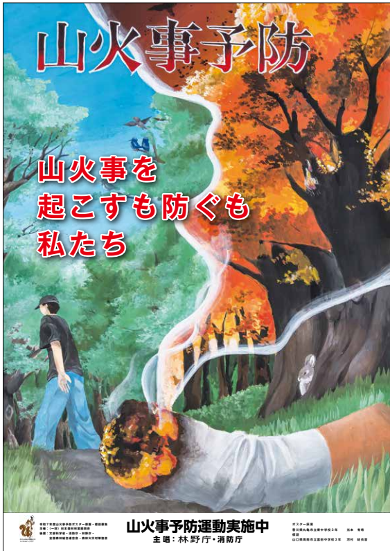
令和8年山火事予防ポスター

一方、令和8年も既に各地で山火事の発生が報じられており、1月に山梨県上野原市・大月市で発生した大規模な山火事では避難指示が発令され、地域住民の生活に大きな影響が出ました。 日本の山火事の出火原因は、たき火、火入れなど人間の活動によるものがほとんどのため、火事につながる行動をしない・させない意識が重要です。「山火事を起こすも防ぐも 私たち」一人ひとりが火の用心を心がけ、日本の森林を守り、後世に引き継いでいきたいと思います。 (注) 林野火災注意報及び林野火災警報は市町村長等により発令される。林野火災注意報の発令時には住民等に火の使用制限の努力義務が課され、林野火災警報の発令時には屋外での火の使用が禁止される。