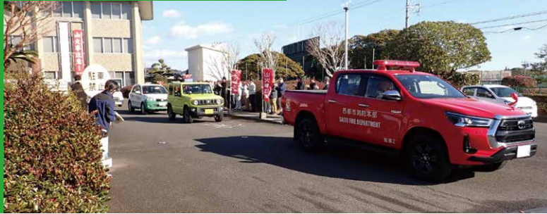
山火事予防普及活動

を統一標語として、「全国山火事予防運動」(統一実施期間：3月1日～3月7日)を実施し、全国で山火事予防意識の高揚を図る取組や、森林パトロール等の実施を呼びかけています。