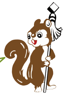
山火事防止のシンボルマーク「まといリス」