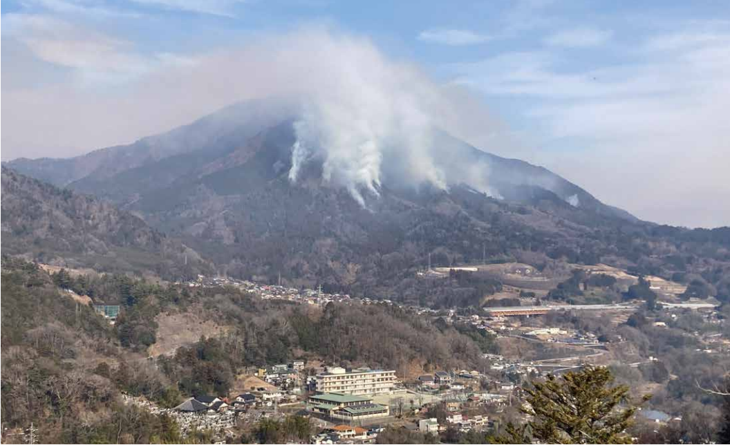
令和8年1月に山梨県上野原市・大月市で発生した山火事