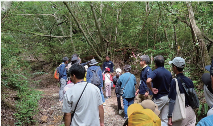
「みらいの里山プロジェクト」の活動