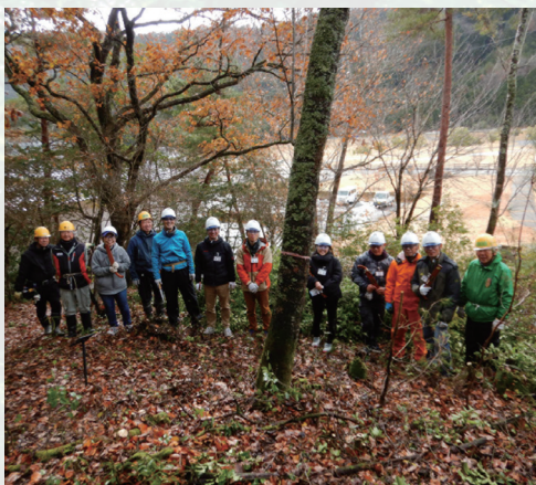
企業等の森林づくりをサポート

1月29日(木)には、木材会館(東京都江東区)において、「企業と森のマッチングセミナー」を開催予定です。本セミナーでは、自然資本経営や企業の環境貢献活動、