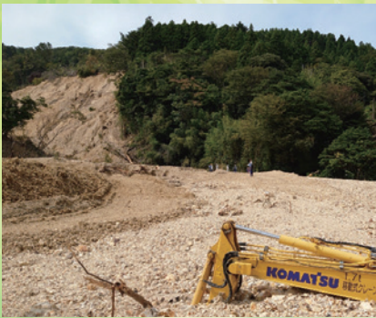
崩壊土砂と重機の埋没(珠洲市大谷町)

当署の事業地においても、地震で崩れた山の斜面に堆積していた土砂が流出し、住宅地を埋め尽くすほどの被害が生じたり、地震後に設置した大型土のうが大量の土砂に覆われたりした被害箇所が見られます。