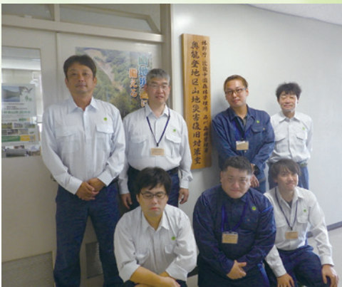
奥能登地区山地災害復旧対策室メンバー（金沢市）

対象となる事業地は、金沢市から約140キロ離れた能登半島の先端部に位置する珠洲市の2区域、その西隣に位置する輪島市の4区域、計6区域です。いずれの区域でも、山の下方に家屋や道路が近接し、地震で流出した土砂や流木によって家屋が倒壊するなど甚大な被害を受けていました。