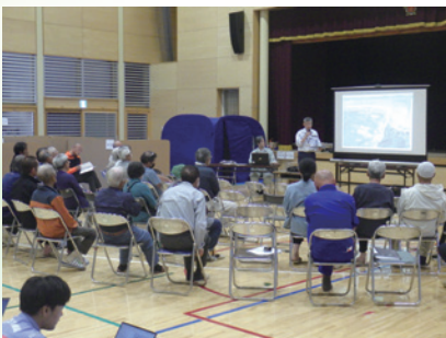
住民説明会(珠洲市大谷町)

工事を進めるにあたって地域の理解と協力を得るため、対策室開設当初から令和7年6月にかけて住民説明会を合計20回実施しました。工事の内容、期間などを丁寧に説明する中で、住民からは、生活道の安全確保や、稲作への水の影響などについて要望等が寄せられる一方、「早く自宅に戻りたい」など、日々重なる思いや切実な声も耳にしました。