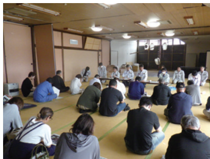
住民説明会(輪島市海士町)