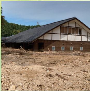
埋没した大谷郵便局(珠洲市大谷町)

た。その一方で、地震の応急対策で設置した土のうが、道路への土砂流出を防ぐなどの効果をもたらした箇所もありました。