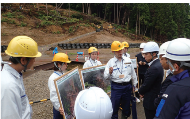
小泉農林水産大臣による現地調査(輪島市三井町興徳寺)

全国各地の森林管理局から派遣されている職員の知識・技術・経験を活かし、奥能登地区山地災害復旧対策室のモットーである「地域に寄り添う」を念頭に、一日も早い復旧・復興に向け、全力で取り組んでまいります。