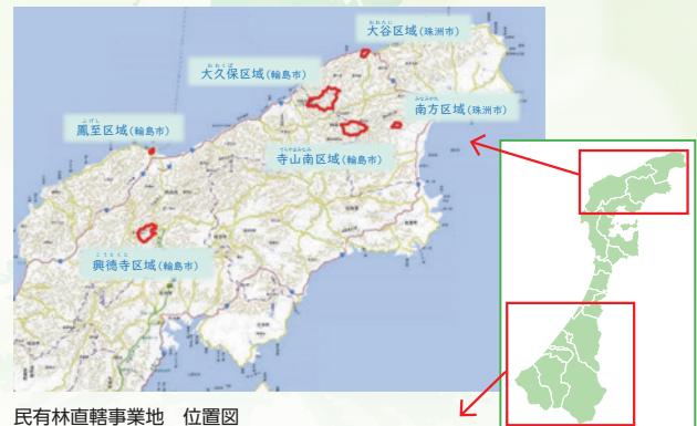
民有林直轄事業地 位置図

多くが保安林、国立公園、国定公園などに指定され、国土保全、水源涵養などの公益的機能の発揮に対する期待が大きく、白山森林生態系保護地域など5箇所を保護林に設定し、生態系の維持などに取り組んでいます。また手取川の上流では治山工事により土砂の流出を防止するなど、保安林機能を高める取組を行っています。