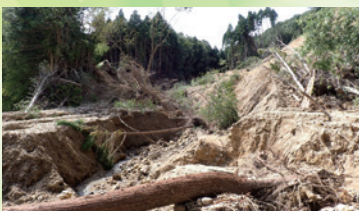
被災後(珠洲市大谷町)

災害を通じて、地域と連携した取組の必要性が一層高まり、関係機関との情報共有を積極的に進めました。特に被害が大きかった珠洲市大谷町では、道路などインフラの復旧が急務となり、機会があるごとに関係する機関と、進捗や課題などの情報共有を図ることを通じて、復旧に向けた取組を円滑に進めることができました。