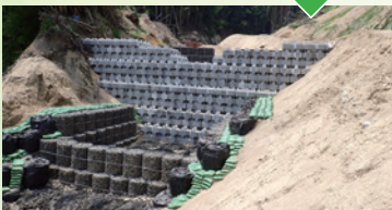
応急対策完了(珠洲市大谷町)