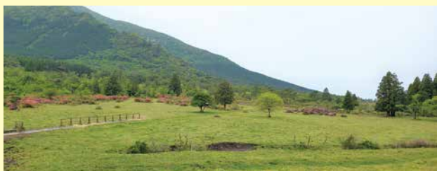
田代原風致探勝林

4月下旬頃から徐々に咲き始めるミヤマキリシマは、5月のゴールデンウィークに見頃を迎え、放牧牛のいる草原の風景とともに楽しむことができます。また、朝には霧がたちこめることが多く、幻想的な風景も楽しむことができます。近接地には田代原野営場があり、夏には涼しい中キャンプを満喫できます。さらに、キャンプ場から九千部岳へ続く九州自然歩道では、7月頃には、吾妻岳の山腹にヤマボウシの白い葉を眺望しながらハイキングを楽しむことができます。車で20～30分ほどの距離に雲仙温泉街と小浜温泉街もあり、温泉に入り1日の疲れを癒すことができます。