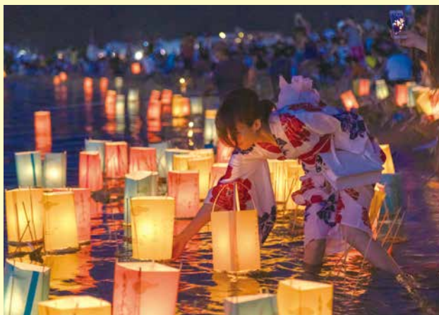
とうろう流し

夏には海水浴場が開設される他、毎年8月には「とうろう流しと花火大会」が県内屈指の規模で盛大に開催されます。また、秋口には波音を聞きながら、美しい夕日や星空を眺めるイベント「波音ハンモック」が開催されています。