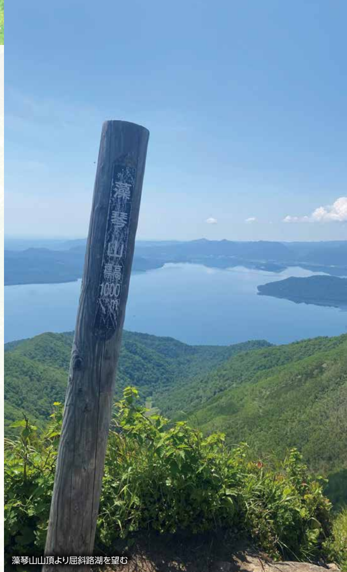
藻琴山山頂より屈斜路湖を望む