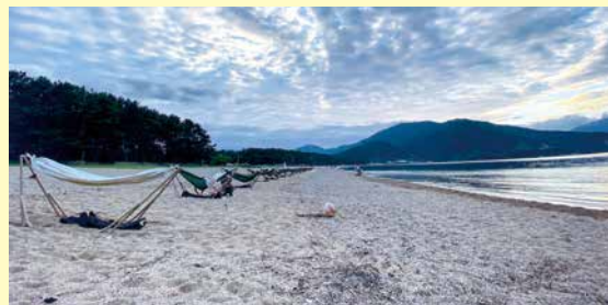
波音ハンモック