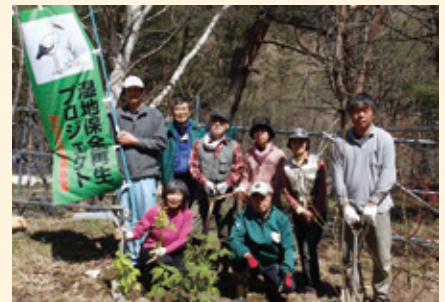
▲ 足尾山地における植樹活動

過去の受賞者については林野庁ウェブサイトをご覧ください。 https://www.rinya.maff.go.jp/j/sanson_ryokka/hyosyo/index.html