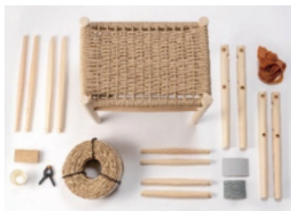
Do it yourself 家具キット