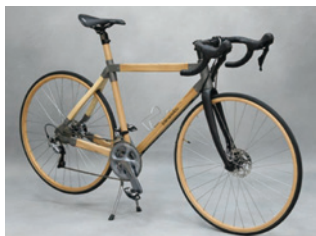
木製自転車スポーツタイプ TR-S 型 E-Thru タイプ