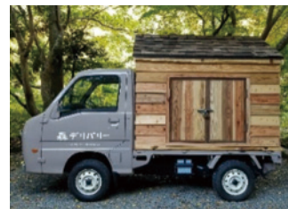
森への入り口をお届けします～森デリバリー～