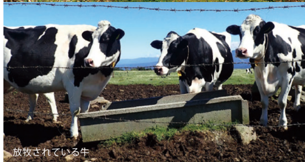
放牧されている牛