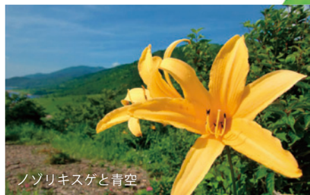
ノゾリキスゲと青空