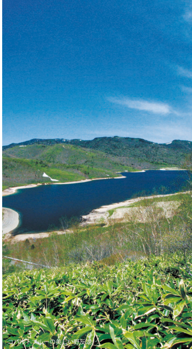
コバルトブルーの美しい野反湖