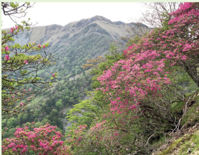
三嶺とミツバツツジ

山頂や稜線まで登れば、視界をさえぎるものがなく、東は剣山、西は石鎚山まで四国の主な山岳、南には土佐湾を望む大パノラマが広がります。