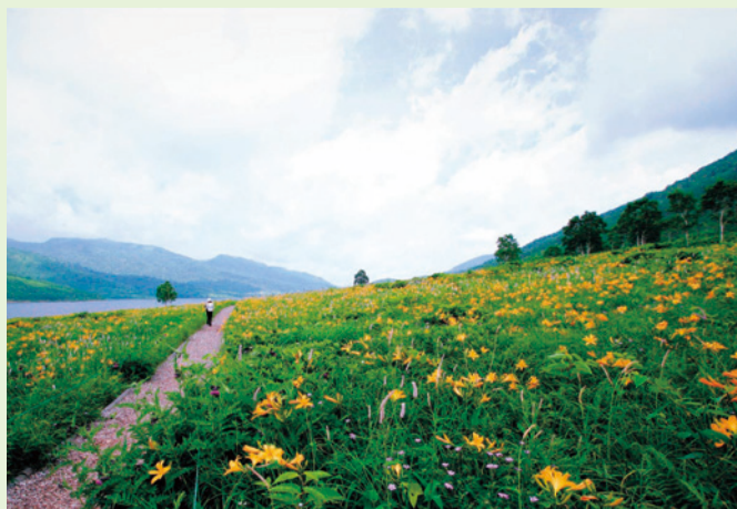
野反湖とノゾリキスゲ