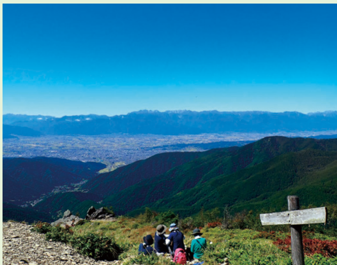
美ヶ原高原山上から北アルプス

天候がよければ、高原のいろいろな場所からアルプス、八ヶ岳、浅間山、富士山などを一望することができます。季節によっては雲海にこれらの山々が浮かんで見えます。