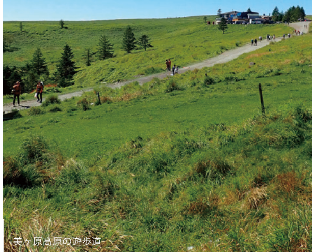
美ヶ原高原の遊歩道