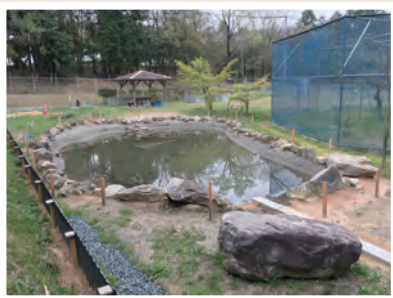
▲ ホトケドジョウのためのビオトープ