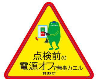
安全確認ステッカー