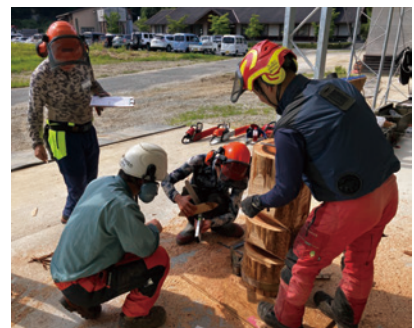
林業労働災害撲滅研修