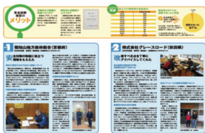
安全診断事業リーフレット

さらに、対策の強化に向けて、伐木作業を始めとする危険な作業の遠隔操作化や自動化の技術開発・実証の取組も進めています。