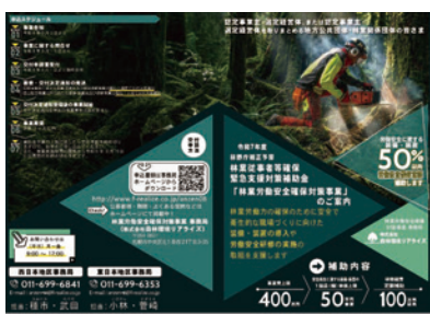
安全衛生装備・装置の導入への支援リーフレット

労働安全確保・経営力強化対策のうち 林業労働安全確保対策事業 https://www.f-realize.co.jp/anzen08/