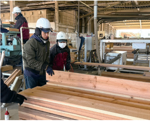
製材工場で活躍する外国人材

林業及び木材産業分野においては、外国人材の就労に当たり、労働安全の確保が重要な課題です。他産業に比べて労働災害の発生率が高い産業であることを踏まえ、特定技能制度全体としてのルールに加えて、特定技能外国人を受け入れる事業者に対して労働安全確保のための追加的な取組を課し、特定技能外国人の適正な受入れを図ることとしています。