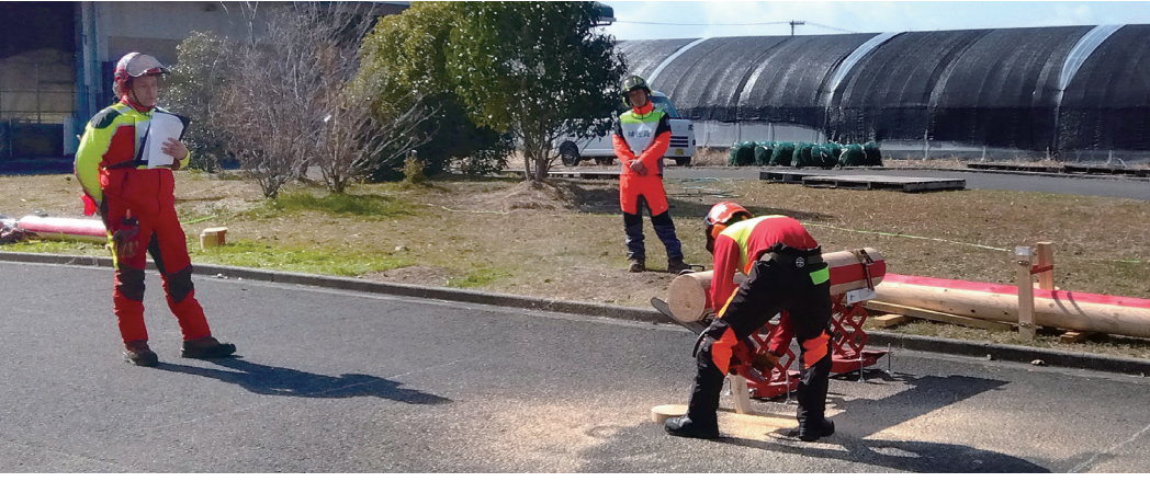
外国人材の技能を評価する試験(林業分野)

そのような外国人材を確保できるようにするため、令和6年9月、「出入国管理及び難民認定法」の関係省令の改正により、林業及び木材産業分野が「特定技能1号」の対象となり、特定技能制度を活用して両産業で就労することが可能となりました。「特定技能1号」は、即戦力となる技能を