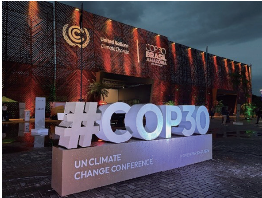
ライトアップされた会場

に取りまとめた「グローバル・ムチラオ決定」が採択されました。また、「緩和作業計画」の交渉においては、森林に関する事項が議論され、採択文書に森林の重要性が明記されました。「グローバル・ムチラオ決定」と各主要議題の決定をまとめて「ベレン・ポリティカル・パッケージ」と呼ばれています。