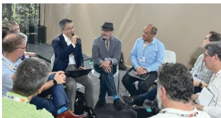
フォレスト・パビリオンでの意見交換