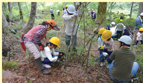
子どもたちの参加による林内整備

（公社）広島県みどり推進機構では、「緑の募金」を活用し、平成10年より「みどりづくり活動支援事業」を実施しています。これまでに行った支援活動は、県内全域で1,000件を超え、里山の保全、学校や公園の緑化、竹林の整備、苗木の植樹、自然観察会や環境学習など多岐にわたります。