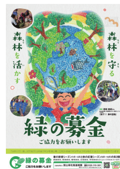
令和7(2025)年 緑の募金ポスター