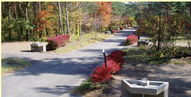
オートキャンプ場

周辺には温泉、食事処、オートキャンプ場などの施設が充実した「岩手山焼走り国際交流村」があり、岩手山麓の大自然を五感で満喫できるアウトドアスポットとなっているので、散策と合わせて訪れてみてはいかがでしょうか。