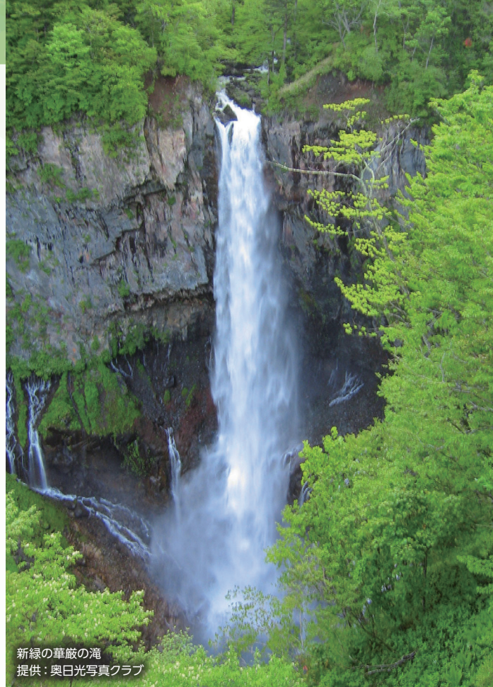
新緑の華厳の滝