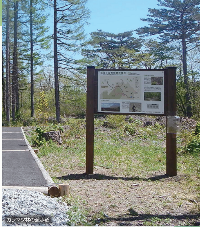
カラマツ林の遊歩道

「焼走り熔岩流」では植生遷移の速度が極めて遅く、コケ植物や地衣類が多くを占めています。また、ゆっくりと遷移していく植生と、溶岩流を間近に観察できる場所としては国内でも珍しく、学術的にも極めて貴重なものとなっています。