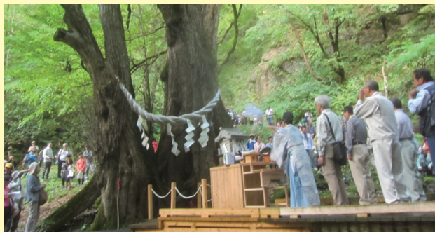
縁桂森林(もりもり)フェスティバル

なお、縁桂を訪ねる際には、地域の熊出没情報などを確認いただき、熊よけ鈴等を持って複数人で行動するようお願いいたします。