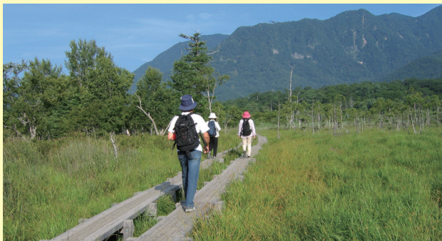
戦場ヶ原でのハイキング

男体山と赤城山の神が争ったという伝説が残る戦場ヶ原のほか、約100haの湿原・草原が広がる小田代原では、写真家の間で「小田代の貴婦人」と称される、緑の背景に純白の木肌が映える1本のシラカバが人気を博しています。数年に一度、長雨や大雨の後にだけ姿を現す幻の湖「小田代湖」も注目を集めます。