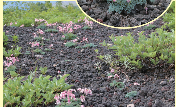
第一噴出口跡上部に咲き誇るコマクサ