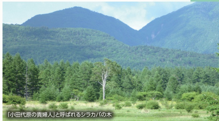
「小田代原の貴婦人」と呼ばれるシラカバの木