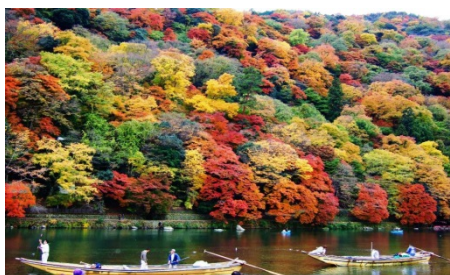
あらしやま 嵐山風景林 (京都府京都市)