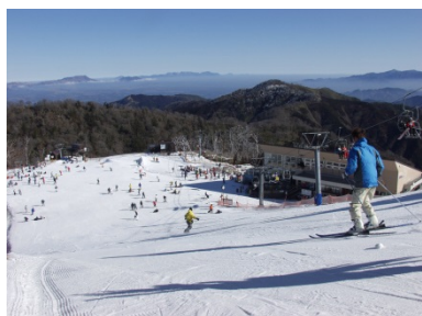
むこうざかやま ごかせ 向坂山野外スポーツ地域(五ヶ瀬ハイランドスキー場) ごかせちよう (宮崎県五ヶ瀬町)