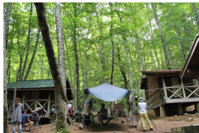
おうぎのせん やずちよう 扇ノ仙森林スポーツ林 (鳥取県八頭町)