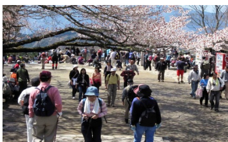
たかおさん はちおうじ 高尾山自然休養林 (東京都八王子市)