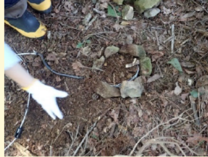
⑤バネと踏み板を土で隠す