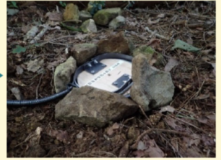
③塩ビ管の上に踏み板をセット