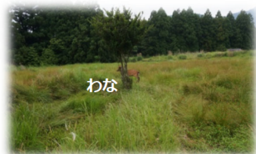
▲ 灌木にワイヤーを根付け