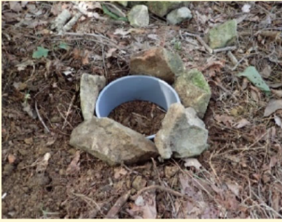
①塩ビ管の周囲に空ハジキ防止の石を並べる