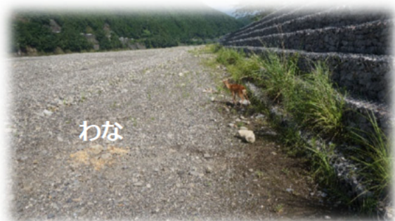
▲ 護岸にワイヤーを根付け