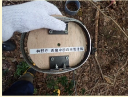
②ワイヤーを根付けし、踏み板にワイヤーをセット