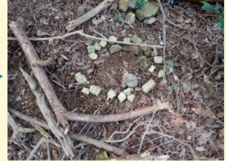
⑥石の周囲に餌を撒いて完成