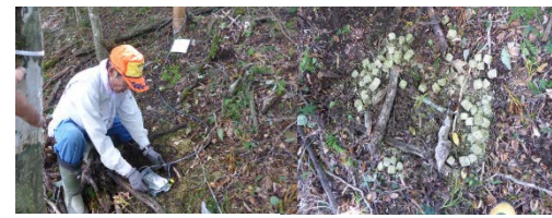
小林式誘引捕獲の開発