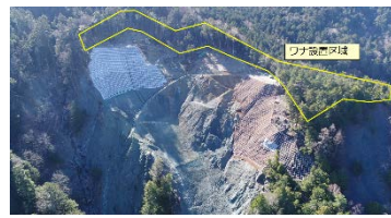
治山工事箇所周辺のワナ設置区域