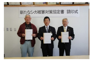
地元市町村等と森林管理署の捕獲等に関する協定締結