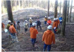
地域関係者との現地検討会の実施