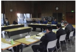
地域の関係行政機関との協議会

地域の関係行政機関や学識経験者、NPO等と連携し、効率的・効果的なシカ被害対策の検討、国有林・民有林が一体となった広域的な捕獲の実施。