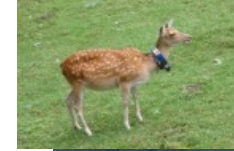
GPS首輪による行動追跡調査

被害防止対策を効果的に実施するための、GPS首輪による行動追跡調査や自動撮影カメラ、ライトセンサ、足跡・糞・食害痕によるシカの出没状況等の調査、植生の被害状況調査を実施。