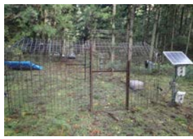
ICT技術を活用した簡易囲いわな