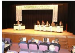
シカ被害対策実施状況等の発表