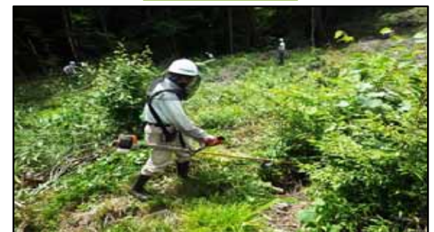
平成28年度 南木曽支署 下刈作業