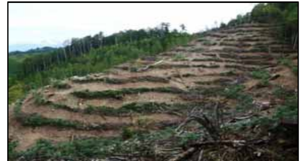
平成28年度 木曽森林管理署 地拵作業