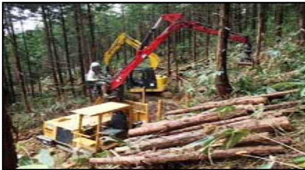
平成28年度 南木曽支署 間伐事業