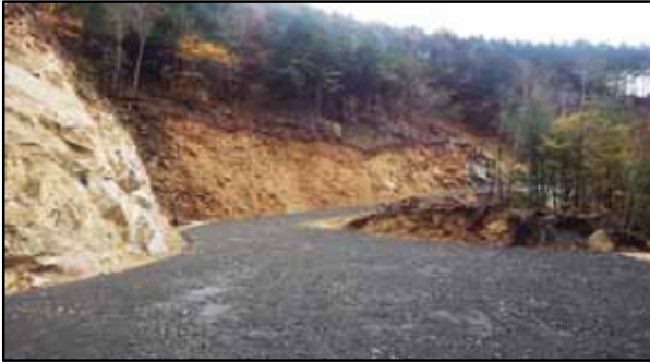
平成27年度 南木曽支署 忠兵衛沢林業専用道新設工事