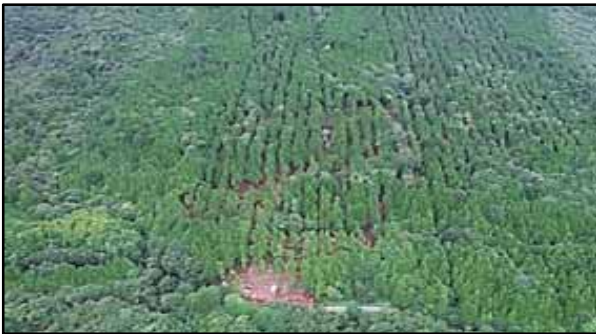
平成28年度 木曽森林管理署 間伐事業