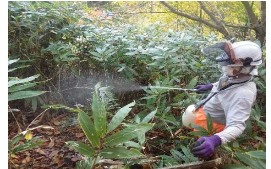
木曾森林管理署（ジラム水和水剤）