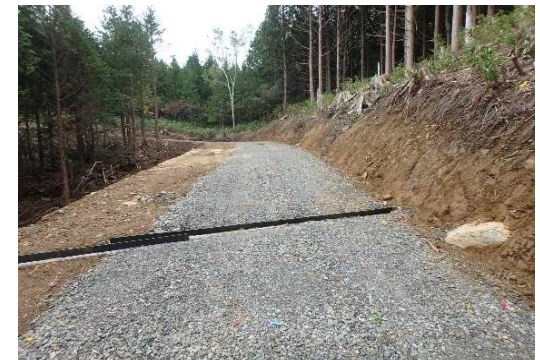
木曾森林管理署 クロブチ林業専用道新設