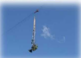
育成受光伐（架線集材）