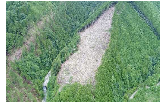
木曾森林管理署南木曾支署（ドローンで撮影）