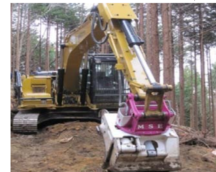
森林整備状況(高性能林業機械による間伐作業)