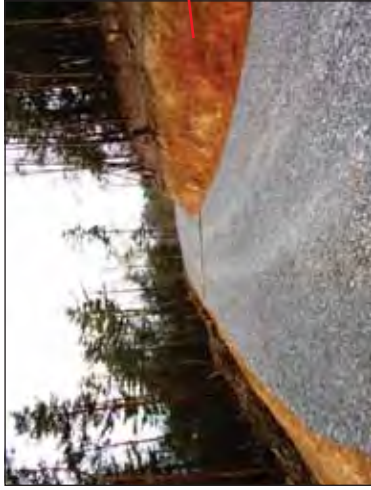
雪彦林専用道新設工事 坂水・雪彦山国有林