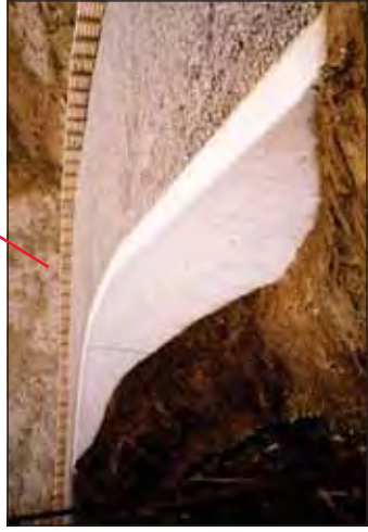
カンカケ三室林道改良工事 赤西国有林