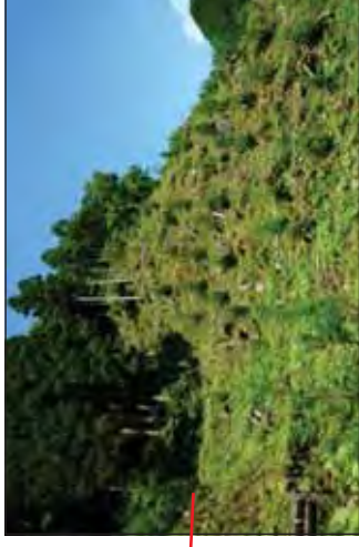
森林整備(下刈作業) 河原山国有林