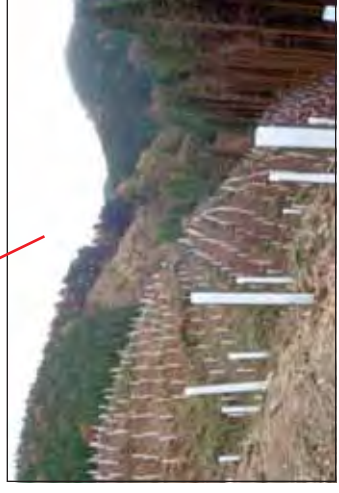
森林整備(植付作業) マンガ谷国有林