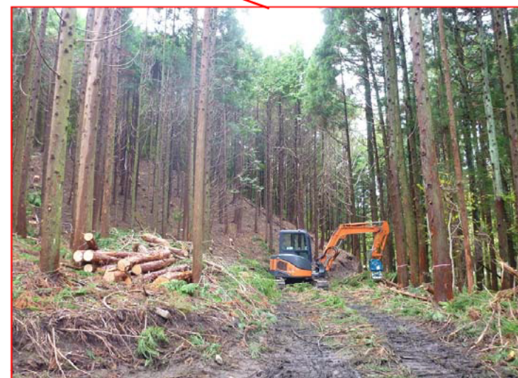
森林整備事業(保育間伐)