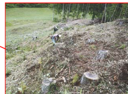
森林整備事業(地拵・植付)