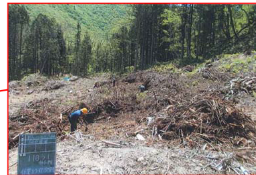
森林整備事業(地拵・植付)